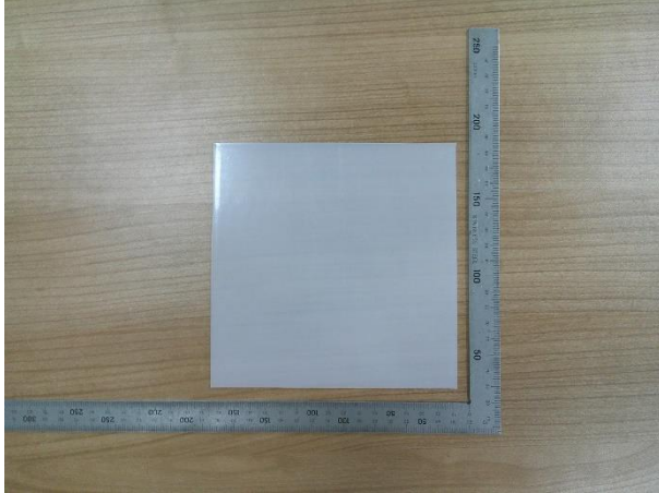
样品 10 / Sample 10